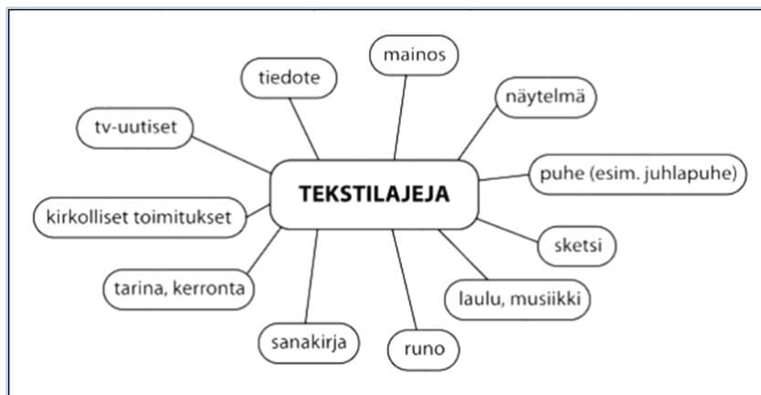
Kuvio 1. Esimerkkejä suomalaisessa viittomakielessä esiintyvistä tekstilajeista (Uusimäki, Haapanen ym. 2015, 8)

keskuksen viittomakielten lautakunta on esitellyt esimerkkejä suomalaisessa viittomakielessä esiintyvistä tekstilajeista (kuvio 1).